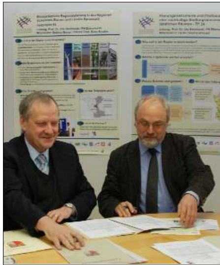
Landrat Bodo Ihrke und Fachhochschulpräsident Prof. Wilhelm-Günther Vahrson (rechts) bei der Vertragsunterzeichnung.

treime Wetterlagen zunehmen: »Am Ende sind wir ohne Wasser oder haben Wasser ohne Ende«, sagte sie. Praktiker und Forscher aus den verschiedensten Bereichen von der Landwirtschaft und Forst über Tourismus bis hin zur gewöhnlichen Trinkwasserbereitstellung müssen nun Lösungen finden, damit umzugehen. Im Projekt INKA BB wird das angepeilt.