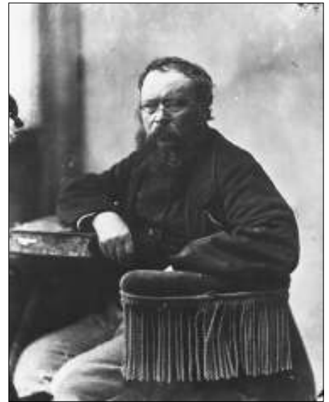
Der französische Publizist und Anarchist Pierre-Joseph Proudhon (1809-1865) zu den »vergessenen« Persönlichkeiten mit runden Geburtstagen im »Gedenkjahr« 2009 (Foto aus dem Jahr 1862). Wenig salongfähig heutzutage ist insbesondere seine Aussage »Eigentum ist Diebstahl«.

Vor 150 Jahren (1859) wurden der jiddische Dichter Scholem Aleichem (»Tewje der Milchmann«), der norwegische Erzähler Knut Ham-