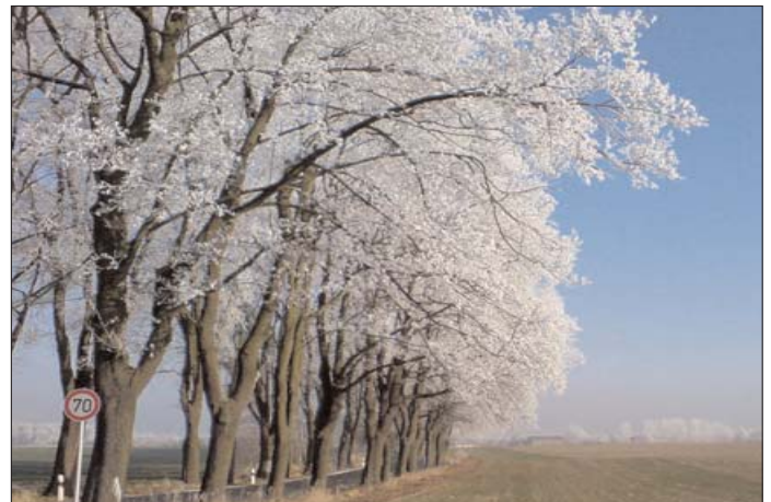
Vor einem Jahr war der Kampf um den Erhalt der Allee bei Rüdnitz unser Topthema. Bei einem Erfolg der »Macher« gäbe es dieses schöne Foto nicht (Schöner und in Farbe auf www.bar-blog.de ).

Wirtschaftsförderung steht auch beim neu gewählten Bürgermeister ganz oben auf der Agenda. Freilich mit anderen Mitteln als bei seinem Vorgänger, bei dem Kommunikation hauptsächlich in Kneipenhinterzimmern oder beim Squash im »Fit und Fun« funktionierte. Nicht alle sind über die Öffnung der einstigen Exklusivität begeistert.