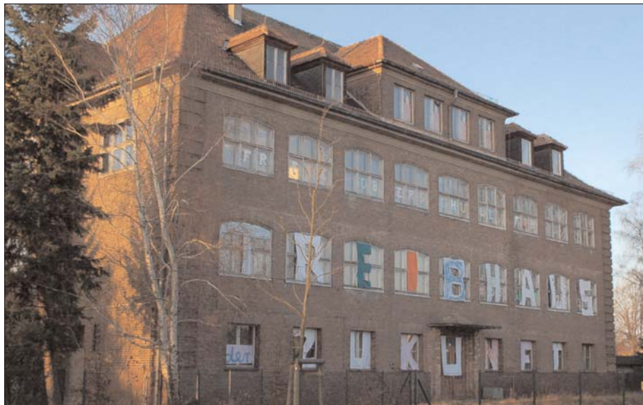
Zu einem »Treibhaus der Zukunft« soll die vom Bündnis für ein demokratisches Eberswalde unterstützte Freie Oberschule Finow werden.

Damit begann das Bündnis eine Serie von »Erklärungen«, mit denen in der Einwohnerfragestunde jeweils zu einem wichtigen Thema der entsprechenden StVV Fragen gestellt sowie Anregungen und Vorschläge unterbreitet wurden. Solche Themen waren: Die Ablehnung der »Transparenzvorlage« der Fraktion Allianz Freier Wähler durch die StVV; Zustimmung zur Einrichtung eines Amtes zur Wirtschaftsförderung in der Stadtverwaltung und Vorschlag weiterer Konsequenzen; die Vorlage der SPD zur Herstellung von Transparenz in kommunalen Unternehmen und Einschränkung der Geheimhaltungspflicht; Forderungen zur lückenlosen Aufarbeitung des Spendenskandals; Vorschläge zur Erarbeitung eines »Bürgerhaushalts« mit dem Haushaltsjahr 2008. Durch Abgeordnete und Stadtverwaltung wer-