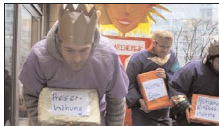
Die »unheiligen« Könige auf der Flucht.