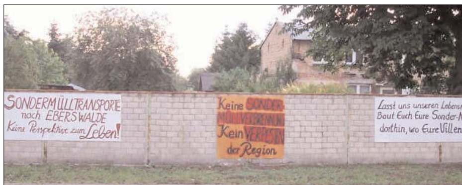
Platkataktion gegen die Errichtung einer Sondermüllverbrennungsanlage in Eberswalde. An der Unterschriftensammlung vor einem Jahr hatten sich 14.000 Bürgerinnen und Bürger beteiligt. Rund 4.000 Einwohner nutzten die Möglichkeit, ihre Einwendungen gegen die Anlage vorzubringen. Die Einwendungen der Bürger wurden vom Landesumweltamt ebenso abgewiesen, wie das ablehnende Votum der betroffenen Gemeinden.