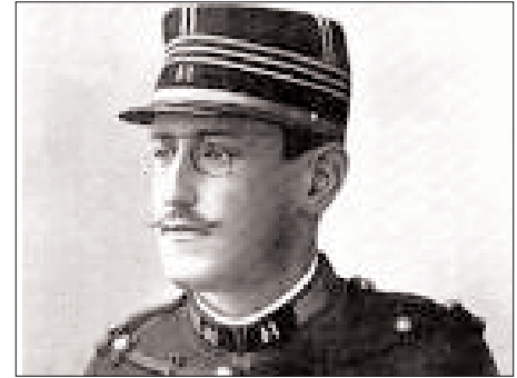
Der Artilleriehauptmann Alfred Dreyfuß

Die Affäre Dreyfus war die Affäre der Militärbürokratie, ein Generalstabsoffizier wird von seinen Kameraden vom Generalstab denunziert und unter Druck des Generalstabschefs verurteilt. Noch einmal: Dreyfus kann nicht als Unschuldiger zurückkehren, ohne daß der gesamte Generalstab der Schuldige ist... Es ist ein Verbrechen, daß man die Armen und