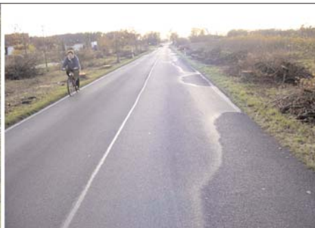
Jahrelang verstümmelt und dann beseitigt: Die kurze Lindenallee in Lichterfelde.